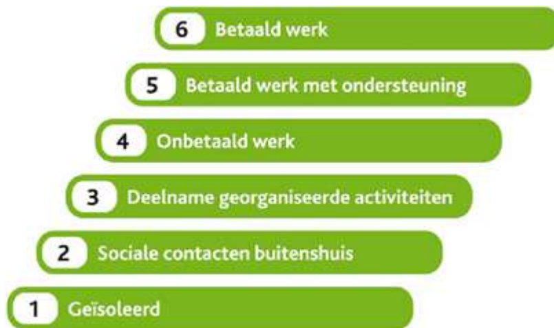
Figuur 1: Afbeelding Participatieladder

Wat verandert er ten opzichte van de bestaande situatie?